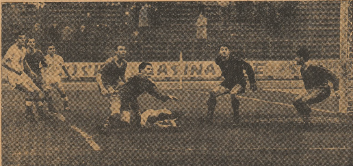
Apărarea dinamovistă face față cu greu atacurilor inițiate de fotbaliștii clujeni. (În fotografie: o fază la poarta lui Dutcu)

Steagul roșu — Știința Timișoara U.T.A. — Siderurgistul Progresul — Dinamo București Steua — Rapid Știința Cluj — C.S.M.S. Dinamo Pitești — Farul Pétrolul — Crîșul (Citiți în pag. 2—3 cronicile meciurilor de ieri).