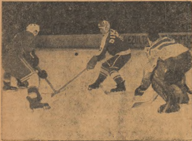
Un aspect din întâlnirea dintre Știința Cluj și Dinamo București

Lungu și Bașa iar pentru studenți Niță și Florescu. A fost un joc dinamic, echilibrat, dar — din păcate — presărat cu multe neregularități. În jocul de ieri dimineață, Știința Cluj a dispus de Steagul roșu Brașov cu 8—7 (2-2, 3-2, 3-3). Au înscris: