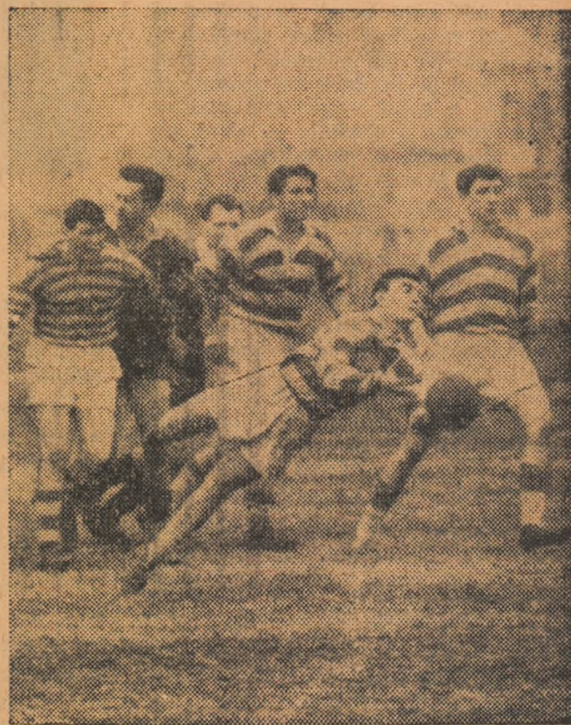
Fază din jocul Unirea — Știința Petroșeni

După o repriză „albă”, în care ambele echipe și-au desfășurat jocul mai mult pe mijlocul terenului, metalurgii iau conducerea prin transformarea, de către Mirza, a unei lovituri de pedeapsă acordată în min. 49. Decizia a fost diferit comentată în tribune datorită faptului că faza a fost destul de