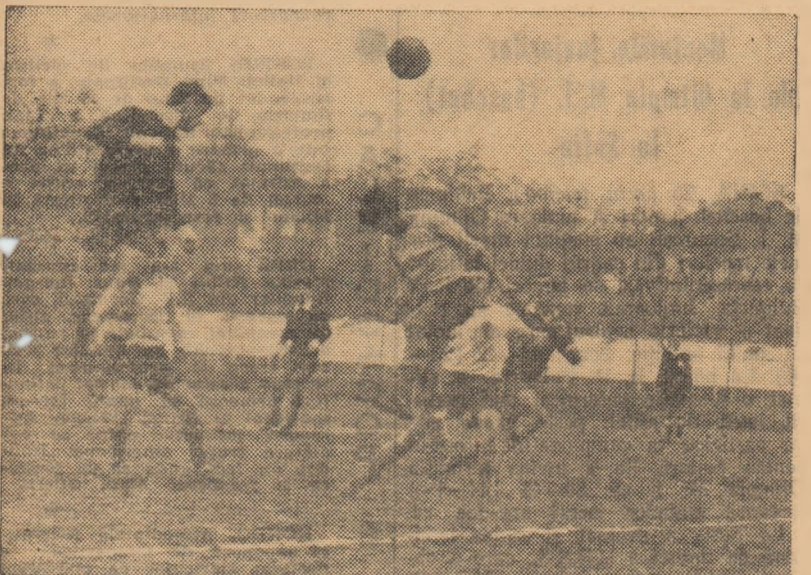
Fază din meciul Dinamo Victoria — Progresul Alexandria.