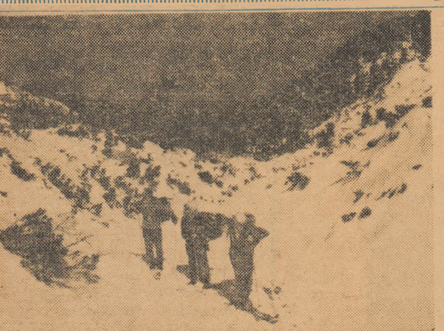
Alpinistul A.S. Armata-Brașov în drum spre creștele Retezatului.

Cluj — ca și în celelalte unități ale țării — se desfășoară permanent o muncă intensă de cuprindere a maselor oamenilor ai muncii de la orașe, la întregul tineret în activitatea organizată și sistematică a exercițiilor fizice și sportive. Sub conducerea organelor și organizațiilor de partid, Consiliului regional, consiliile raionale UCFS, cluburile și asociațiile sportive pun în centrul preocupărilor lor dezvoltarea activității sportive a maselor, creșterea continuă a calității acestora.