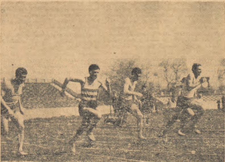
Cursa seniorilor pe 100 m.