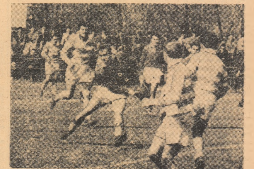
Un nou atac al militarilor. Fază din jocul Steaua-Stiinta Cluj.

ALTE REZULTATE: Ancora Galati- Rulmentul Birlad 3-3 (0-3); CSMS Iasi-Progressul 3-9 (0-0); Stiinta Petroșeni-Dinamo 3-6 (3-6).