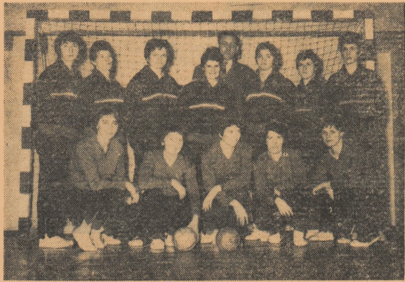
După un antrenament lotul echipei de handbal Rapid suride obiectivului fotografic

Campioana țării la handbal a plecat la Bratislava pentru finala „C. C. E.”