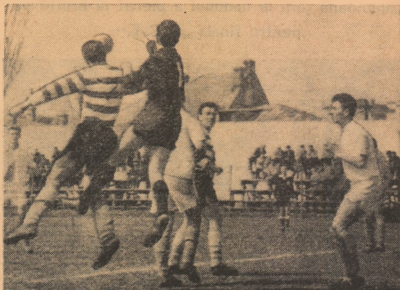
Fază din meciul de fotbal de cat. C dintre echipele Flacăra roșie București — Electrica Constanța

O nouă etapă — cea consumată duminică — nefavorabilă liderilor campionatului categoriei C. Într-adevăr, în seria Sud, C.F.R. ROȘIORI a pierdut jocul cu Victoria Giurgiu, în seria Nord, RECOLTA CAREI a „lăsat” un punct Faianței Sighișoara, iar în seria Vest, METALUL TURNU SEVERIN a căzut pe poziția a treia prin înfringerea suferită la Tg. Jiu. De pe urma acestui „duel” purtat de două formații din regiunea Oltenia a profitat Vagonul Arad care, câștigând în deplasare în dauna lui Electromotor Timișoara, s-a instalat, deocamdată, în fruntea clasamentului. În seria Est, LAMINORUL BRAILA nu și-a susținut meciul cu Dinamo Suceava, deoarece 6 jucători dinamoviști s-au îmbolnăvit cu puțin timp înainte de meci.