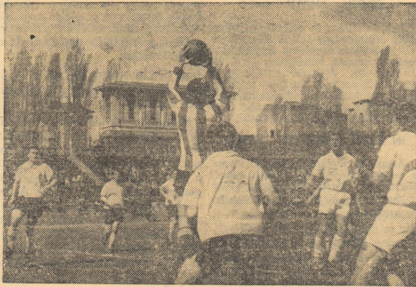
Portarul Flacării roșii prinde o minge înaltă. Fază din meciul Dinamo Victoria — Flacăra roșie, disputat duminică pe stadionul Dinamo

RECOLTA CAREI — RAPID TG. MUREȘ (7-0) Terenul desfundat n-a constituit o piedică prea mare pentru echipa locală, care a practicat un joc bun. Realizatorii golurilor: Peș II (min. 16 și 87), Bohonyi (32), Hauler II (35 și 48), Horilă (55) și