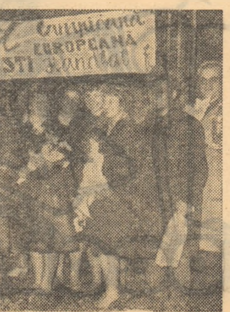
Chîștigătoarele „Cupei campionilor europeni”

Bucuria victoriei se îmbină cu dorința vie a unor noi succese de prestigiu și cu aceeași urare adresată tuturor sportivilor, spre cîntarea mișcării sportive din patria noastră.