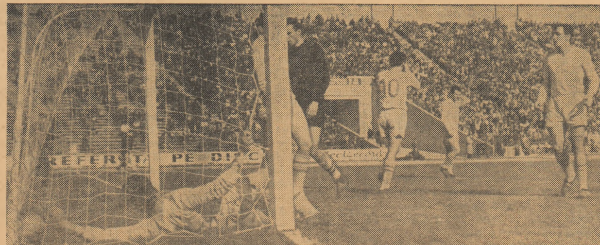
Dezolare în tabăra gălățeană. Bucureștenii au înscris al treilea gol cu care s-au desprins în câștigători

Românie. Ca și în prima partidă, victoria a revenit sportivilor români, de astă dată cu scorul de 2—0 (0—0, 1—0, 1—0, 0—0). Punctele au fost înscrise de Grințescu și Kroner.