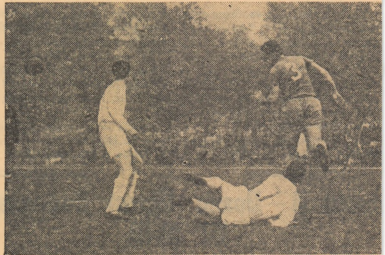
Rarele acțiuni ale bucureștenilor au găsit apărarea oaspeților la da

capătății atacanților și apărării supra-nerice a formației Foresta. (Constantin Enea, coresp.)