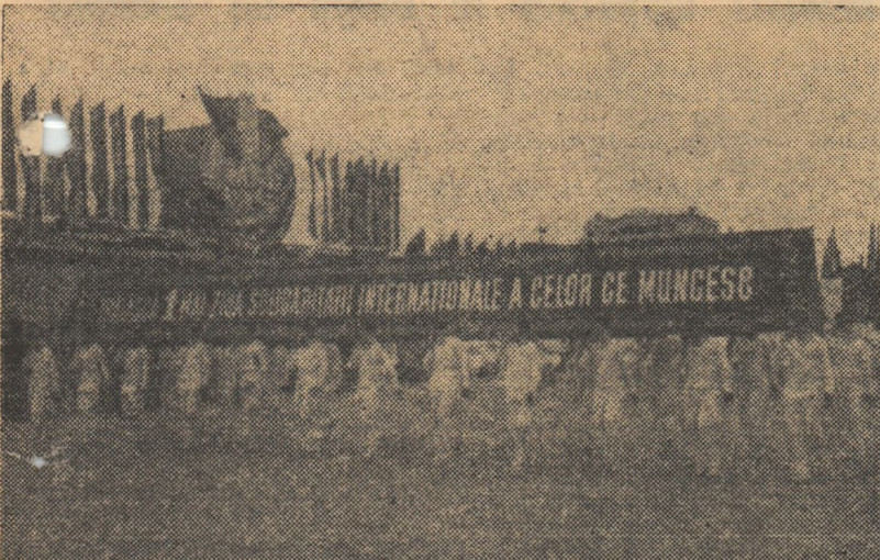
Începe parada sportivilor... Un grup de tineri poartă lozincă tradițională sărbătoririi zilei de 1 Mai

Sărbătorind cu entuziasm ziua de 1 Mai, oamenii muncii din țara noastră și-au exprimat dragostea și atașamentul față de partid și patria socialistă, prietenia frățească cu popoarele țărilor socialiste, solidaritatea cu clasa muncitoare internațională, cu forțele păcii și progresului de pretutindeni.