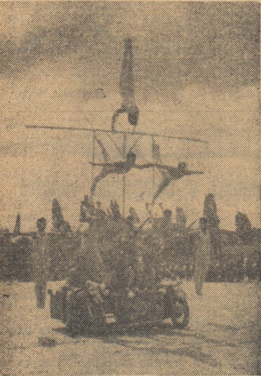
O splendidă piramidă pe motocicletă efectuată de gimnastii dinamoviști