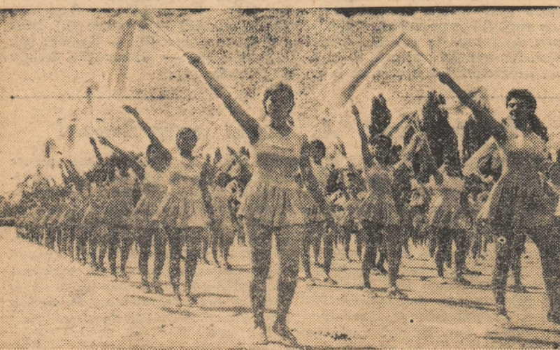
Pe platoul din piața Aviatorilor, dansul eșarfelor stârnește ropote de aplauze. Execută tinerele reprezentante ale Clubului sportiv școlar bucureștean