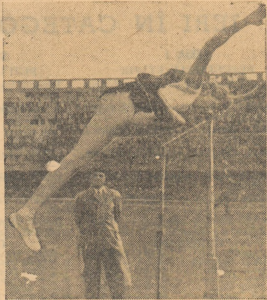
Iolanda Balaș trece stacheta înălțată la 1,87 m.

Simbătă, la Ploiești, Iolanda Balaș a încercat să se apropie din nou de recordul lumii. Pe drumul spre 1,92 m, sau spre mai sus, ea s-a oprit, deocamdată, la 1,87 m. Încercarea aceasta i se pare însă mai mult decât semnificativă. Nu ne gândim la faptul că 1,87 m reprezintă cea mai bună performanță mondială a anului sau că ea depășește cu 16 cm cerințele normei olimpice, ci la condițiile în care a fost realizată. N-o să insistăm asupra ploii care a căzut în clipa dinaintea concursului, ci ne vom opri asupra amănuntului că aceasta a fost, de fapt, prima evoluție a Iolande Balaș în acest an olimpic, că până ce a cerut să i se pună stacheta la 1,87 m, ea a făcut doar foarte puține antrenamente specifice de săritură și tocmai din acest motiv, elanul nu a putut ajunge la acea siguranță caracteristică. În general, „jitnul” să-