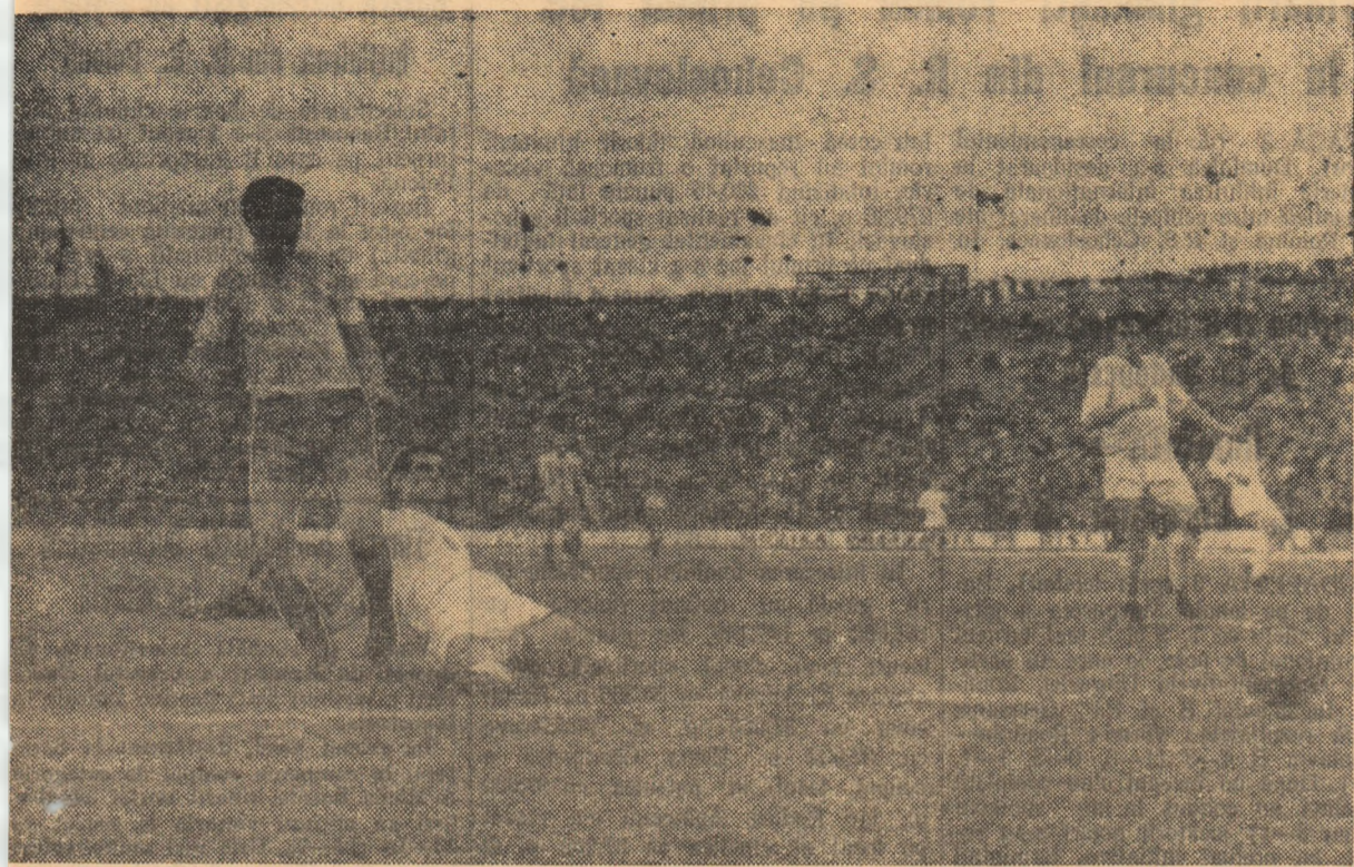
2-0 pentru noi! Constantin a trecut în dribling de apărarea oaspe și a marcat.