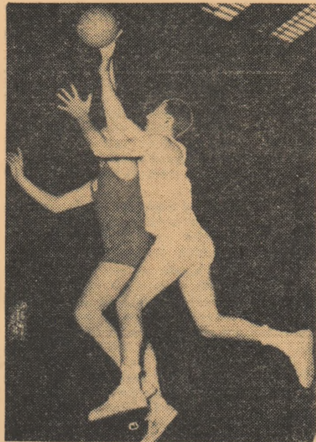
Nedej (Steaua) aruncă spectaculos la coș

rezerve, care timp de 10 minute a făcut joc egal cu prima formație a militarilor (12—12)! Campionii, cu cunoscutele lor