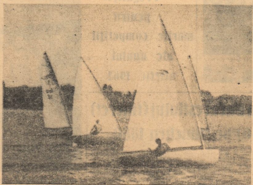
Luptă strînsă în regata inaugurală...