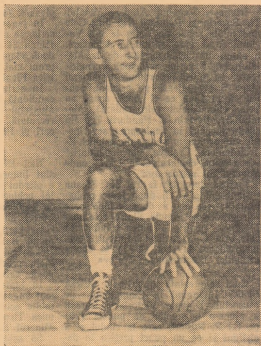
Bob Cousy, cel mai bun jucător american din toate timpurile

Pentru a face parte dintr-o astfel de echipă, jucătorul trebuie să fie un adevărat virtuoz al baschetului. Și Jerry Lucas și Oscar Robertson, doi dintre cei