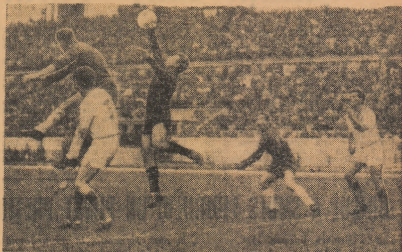
Portarul orădean, Duca, „boxează” o minge înaltă.

Scor: Dinamo București — Crișul 1-1 (1-0)