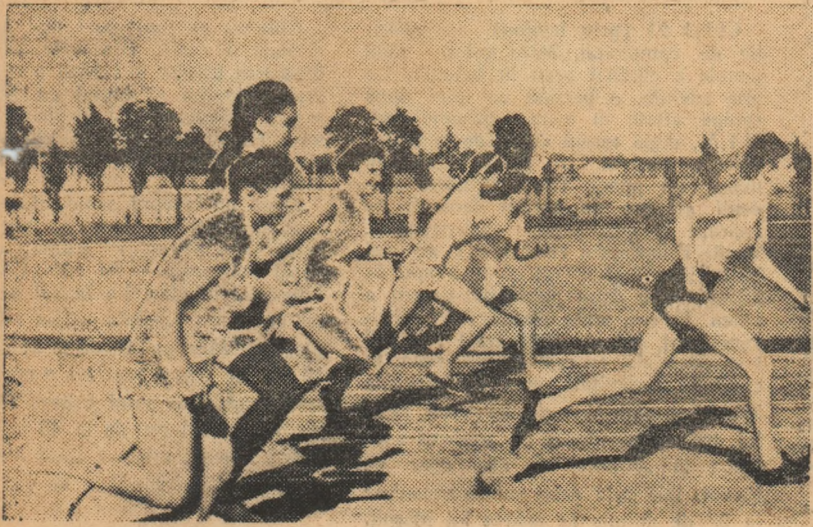
Start în cursa de 100 m!