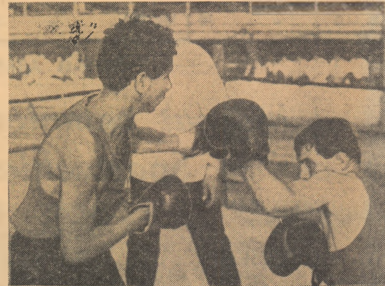
Aspect de la o reuniune de box disputată pe stadionul Giulești în Spartachiadei republicane.