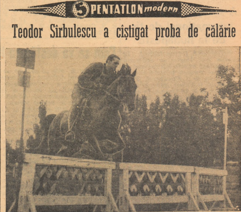
Iată-l pe învingător trecînd peste un obstacol.