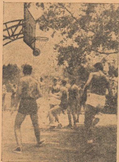
Baschetbaliștii din Pitești și Drăgănești și dispută cu pasiune întrecerea.