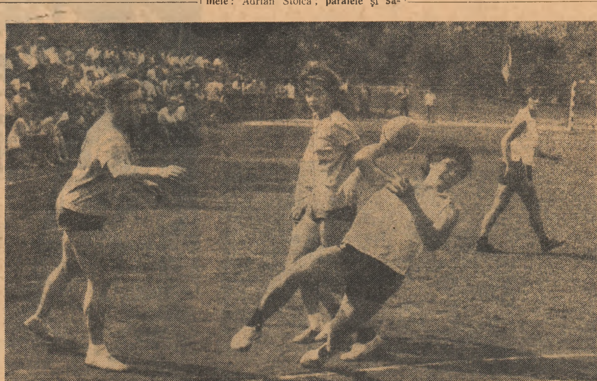
Fază din meciul Avintul Confecția—Flacăra C.P.B. cîștigat de prima formația cu scorul de 7—2 (5—0)

În regiunea Suceava, lotul feminin se află la Suceava, iar cel masculin la Botoșani, deoarece majoritatea sportivilor și sportivelor sînt din aceste două orașe. Pregătirile se desfășoară în bune condițiuni și deschid perspectiva unei bune comportări a celor 4 reprezentative.