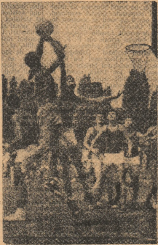
La spectaculoasă aruncare la coș realizată în ciuda opoziției apărătorului. Fază din meciul Academia Militară — Voința

tehnic: tur preliminar: Olimpia raionul T. Vlađimirescu — Avântul r. 16 Februarie 5-4, Constructorul r. N. Bălcescu — Metalul r. 23 August 5-4, turul I: Progresul r. Lenin — Dinamo 5-0, Rapid r. Gr. Roșie — Olimpia