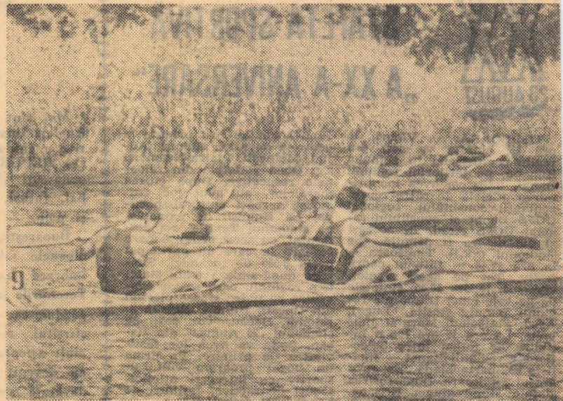
Echipe de caiac dublu, în plin efort, la o recentă competiție de tineret.

lături de acești sportivi care și-au cîștigat dreptul de participare în finală vor concura și o serie de invitați F.R.S.N., tineri talentați, care s-au evidențiat cu ocazia calificărilor. Orașele mai bogat reprezentate sînt București, Timișoara și Tg. Mureș. Este așteptat ca preliminariile de vineri, cî mai cu seamă finalele propriu-zise, sîmbătă, să dea loc la dispute deosebite de echilibrate, ca lupta pentru cucerirea titlurilor de campioni republicani de juniori să confirme progresul celor înregistrați pe plan intern, de mulți ani, la caiac-canoa.