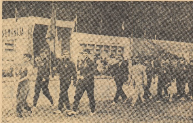
Echipele R. P. Romîne defilînd la festivitatea de deschidere a întrecerilor atletice de juniori de la Subotica.

Înaintea meciului, gazdele noastre — tehnicienii și organizatorii iugoslavi — făcînd un calcul al hîrtiei, socoteau că vor avea „de furcă” în principal cu echipa Poloniei, marea favorită a acestei întîlniri, lăsînd pe... planul doi pe romîni. Duminică seara, la încheierea