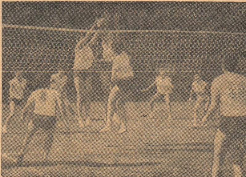
Fază din întâlnirea feminină dintre reprezentativele orașului București și regiunii Brașov

miază reține atenția în special prin meciurile masculine (Cluj — Dobrogea și oraș București — Galați), deschise oricărui rezultat și promițând