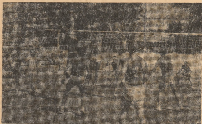
Atacul lui Timirgazin (Dobrogea) va fi respins de blocajul gălățenilor

În meciurile finale pentru stabilirea clasamentului general, au fost înregistrate rezultatele: Iocurile 1-2 Cluj—oraș București 5-4 (Negulescu Ionescu Soare 2-0, Maria Biro Marta Tompa 0-2, Negulescu, Giurgiuca-Popescu, Gantner 2-0, Veis-Ella Constantinescu 0-2, Giurgiuca-Popescu 2-0, Iudic Crejec, Maria Biro-Maria Alexandru, Ella Constantinescu 0-2, Bodea-Gantner 2-1, Iudic Crejec-Maria Alexandru 0-2, Iudic Crejec, Giurgiuca-Ella Constantinescu, Gantner 2-1), Iocurile 3-4 Banat—Brașov 9-0 (Cărnăzan—București 2-1, E. Mihalca-I. Sandu 2-0, L. Sălăgeanu-I. Gheorghe 2-0, Șuba Zamfir 2-0, Iovan-Stoian 2-1, H. Demetrevici-I. Chiriac 2-0), Iocurile 5-6: Mureș—A.M.—Hunedoara 6-3, Iocurile 7-8: Ploiești—Crișana 6-3, Iocurile 9-10: Oltenia — reg. București 5-4, Iocurile 11-12: Maramureș—Bacău 5-4, Iocurile 13-14 Iași—Galați 5-4, Iocurile 15-16 Dobrogea—Suceava 8-1. Clasamentele generale: I. CLUJ — campioană, Spartachiadei republicane, 2. oraș București, 3. Banat, 4. Brașov, 5. Mureș—A.M., 6. Hunedoara, 7. Ploiești, 8. Crișana, 9. Oltenia, 10. reg. București, 11. Maramureș, 12. Bacău, 13. Iași, 14. Galați, 15. Dobrogea, 16. Suceava, 17. Argeș.