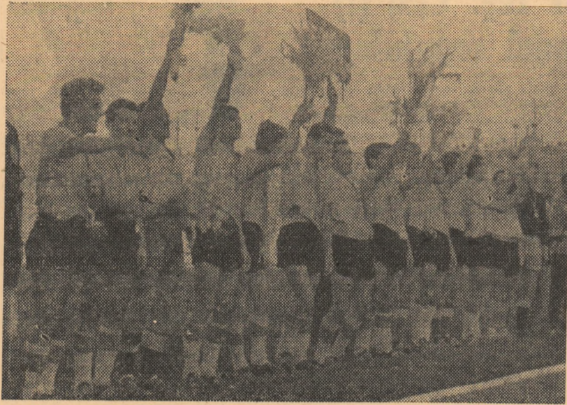
Iată-i pe câștigătorii titlului de campioni la fotbal ai primei Spartachiade republicane. Bucuria de pe fețele lor ne scutește de orice alte explicații