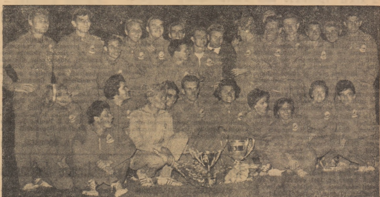
După victorie! Echipetele noastre, avînd în față cupele balcanice cucerite