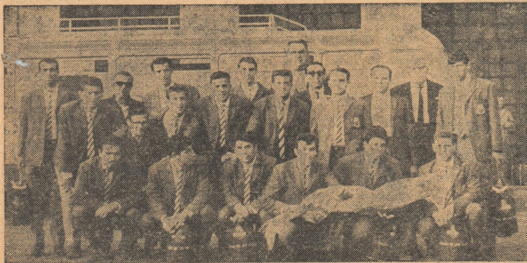
Fotbaliștii de la Sliema Wanderers (Malta) au sosit ieri dimineață în București. Iată-i în fața obiectivului fotoreporterului nostru

La trei zile de la finala „Cupa Balcanică”, marele nostru stadion „23 August” își va deschide din nou porțile pentru numeroșii iubitori ai fotbalului din Capitală. Pe programul de azi figurează meciul internațional dintre formațiile de club DINAMO BUCUREȘTI și SLIEMA WANDERERS, care se reintâlnesc în primul tur al „C.C.E.”, ediția 1964-65.