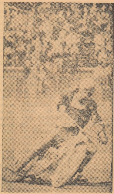
Ion Cucu (Metalul) evoluînd pe pista de zgură a stadionului Dinamo din Capitală.

Tot duminică dimineață, de la ora 10, va avea loc pe stadionul Dinamo din Capitală faza a doua a campionatului republican de dirt-track. Această fază programează 12 manșe și o manșă amînată din faza I. Iată clasamentul înaintea acestei faze: 1. R. Jurcă (Steaua) 13 p; 2. I. Cucu (Metalul) 12 p; 3. Al. Datcu (Steaua) 11 p; 4. M. Alexandrescu (Metalul) 9 p; 5. Al. Pop (Dinamo) 8 p; 6. Gh. Voiculescu (Steaua) 7 p; 7. C. Radovici (Metalul) 3 p; 8. R. Temistocle (Dinamo) 2 p.