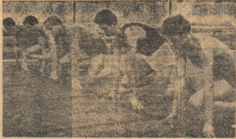
Tineri de la A.S. Banatul Timișoara, la startul probei de 100 m desfășurată în cadrul campionatului asociației.