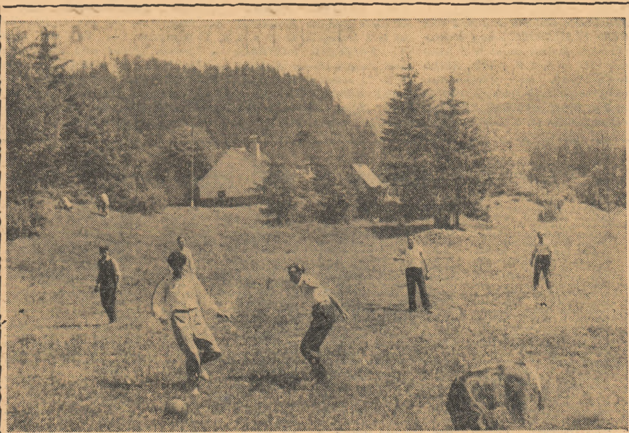
În excursie... Popasul este folosit pentru angajarea unei scurte partide de fotbal pe... gazonul din poiană. Odihnă activă!