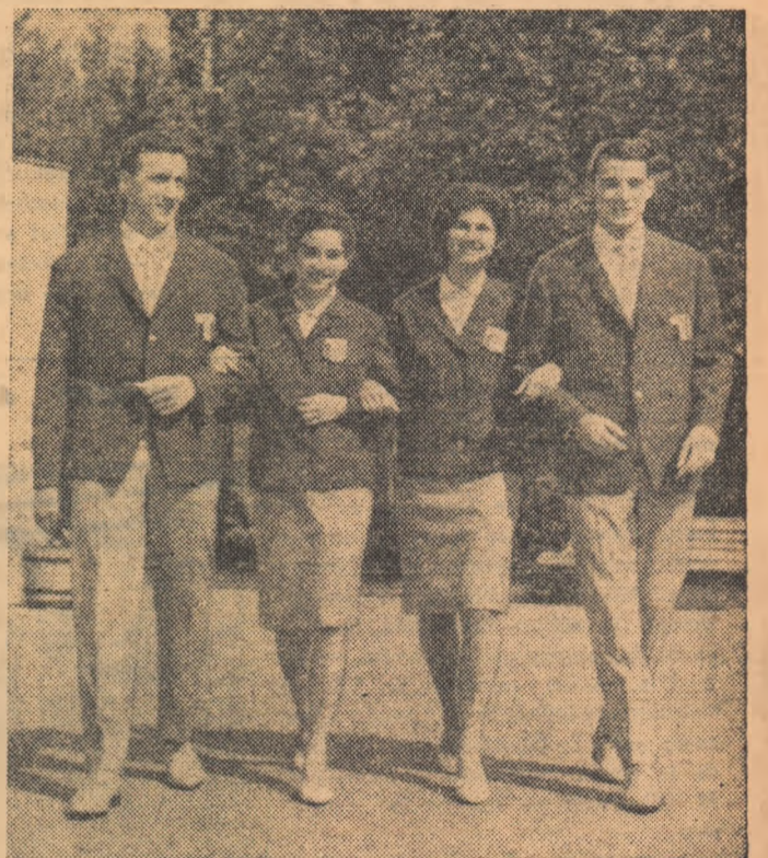
Iată unul din costumele pe care le vor purta olimpicii noștri.