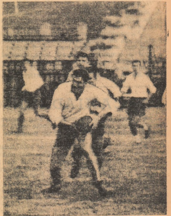
Fază din meciul Gloria—Dinamo

Jocurile etapei de duminică au prilejuit cîteva comentarii interesante care se referă în special la echipele care ocupă primele cinci locuri în clasamentul categoriei A. Păstrînd... ordinea din plutonul fruntas, vom remarca jocul bun prestat de Steaua și această apreciere nu are în vedere exclusiv scorul realizat în fața formației gălățene, ci varietatea tactică a atacului, buna pregătire fizică și seriozitatea cu care militarii au privit meciul de la primul pînă la ultimul minut. Foarte bună și evoluția Griviței Roșii la Cluj. În special după pauză, grivițenii și-au impus autoritar jocul, au dominat și au creat faze deosebit de spectaculoase. De data aceasta, legătura dintre compartimente a funcționat mai bine și, în general, echipa bucureșteană a dovedit omogenitate.