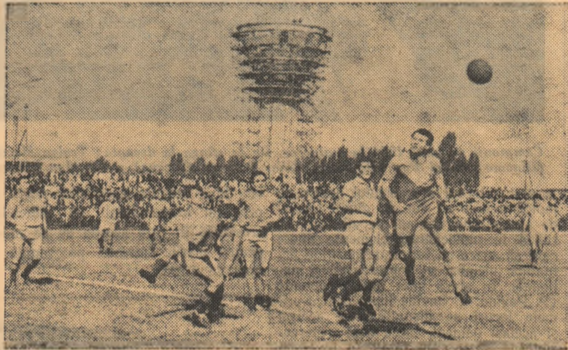
Luptă acerbă pentru balon în partida Metalul București—Siderurgistul Galați (2-0)