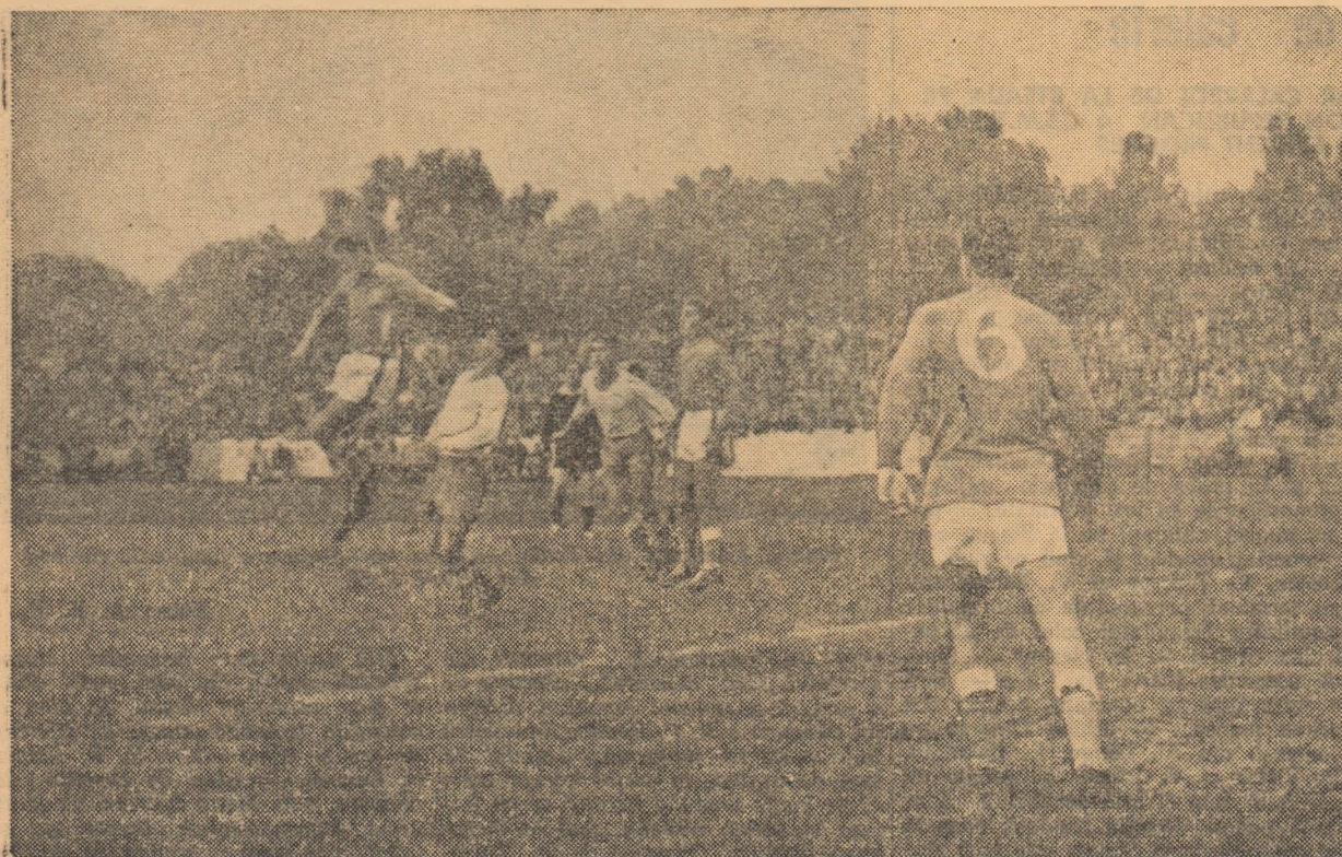
Apărarea brașovenilor (aci, în plină acțiune), a avut un cuvînt important de spus în meciul Progresul-Steagul roșu (1-1).