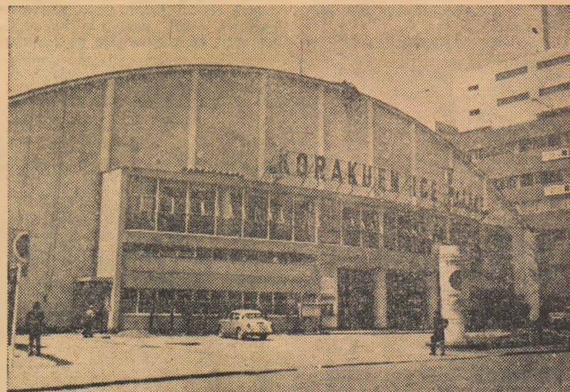
Palatul Korakuen din Tokio, unde se vor desfășura întrecerile de box din cadrul J. O.

cordurile Inului de stat al R. P. Romîne, pe catarg a fost înălțat drapelul patriei noastre. A fost un moment înălțător, care ne-a emoționat pe toți, și sperăm să-l trăim de cît mai multe ori în timpul desfășurării întrecerilor olimpice.