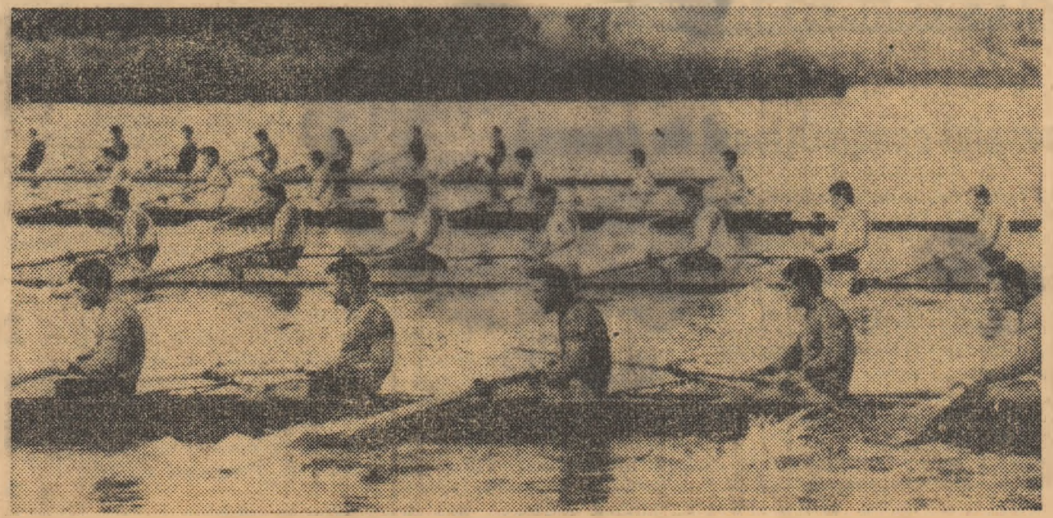
Echipele de schif 8+1 la începutul cursei