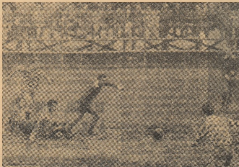
Fază din meciul Flacăra roșie Buc. — Dinamo Victoria București (3-1).

Aruncînd o privire asupra jocurilor care vor avea loc duminică în categoria C, se poate constata că cele mai interesante par a fi Viitorul Suceava — Metalul Rădăuți, Chimia Onești — Foresta Fălticeni (seria Est), Rulmentul Brașov — Flacăra roșie București, Electrica Constanța — Electrica Fieni (seria Sud), Metalul Hunedoara — Minerul Deva (seria Vest), I.R.A. 2 Tg. Mureș — Faianța Sighișoara, Arieșul Turda — Minerul Bihor (seria Nord).