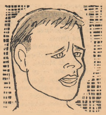
DON SCHOLLANDER (S.U.A.) natație - 100 m liber bărbăți