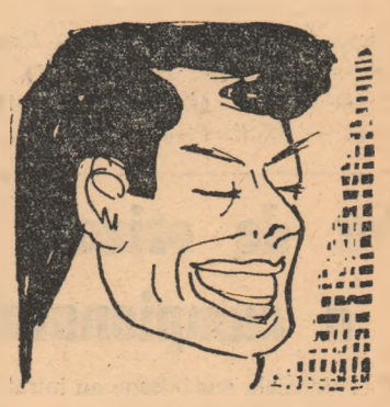
YOSHINOBU MIYAKE (Japonia) haltere - categoria pană