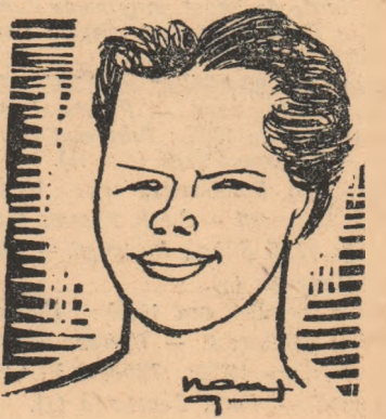
INGRID KRAMMER (Germania) natație - sărituri de pe trambulină