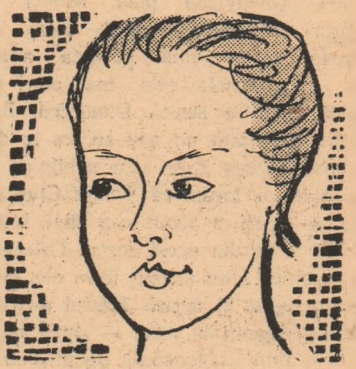
GALINA PROZUMENCIKOVA (U.R.S.S.) natație - 200 m bras jemei