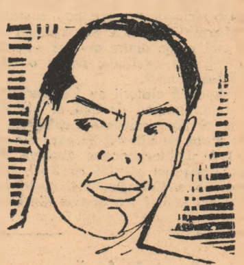
ALEXEI VAHONIN (U.R.S.S.) haltere - categoria cocos