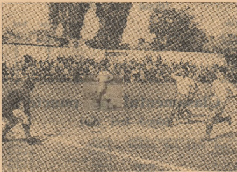
Fază din meciul Flacăra roșie — Rapid Mizil (1-1).

echipe. Ar fi de dorit ca cei care au în grijă această bază sportivă să dea dovadă de mai mult simț gospodăresc în ce privește întreținerea terenului de joc. Un rezultat frumos a înregistrat, tot în seria Sud, Progresul Alexandria care a întrecut cu 2-0 formația Vi-