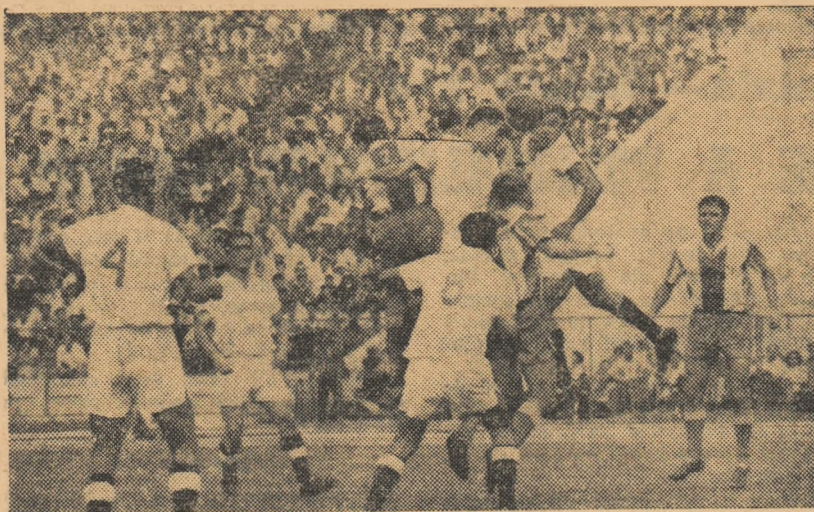
Un „bucet” de jucători în luptă pentru balon. Fază din meciul Progresul București — Dinamo Pitești disputat în sezonul trecut