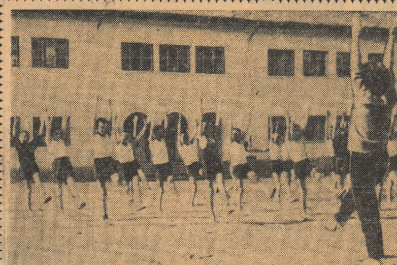
Concursurile pentru Insigna de polisportiv se bucură de multă popularitate în școlile profesionale din regiunea Argeș. În fotografie, tinerii de la Grupul școlar profesional Ștefănești pregătindu-se pentru proba de gimnastică din cadrul Insignei de polisportiv.