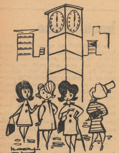
— De cînd cu Olimpiada asta la televizor... Desen de Neagu Rădulescu

Prin urmare, în competițiile oficiale din Europa, rezervate echipelor de club, programul echipelor noastre în turul al doilea este următorul: În „Cupa campionilor europeni”: DINAMO BUCUREȘTI — Internazionale Milano; În „Cupa cupelor”: STEAUA — Dinamo Zagreb; În „Cupa orașelor tîrguri”: PETROLUL PLOIEȘTI — Lokomotiv Plovdiv. Meciurile se dispută tur-retur, și trebuie jucate pînă la 15 decembrie.