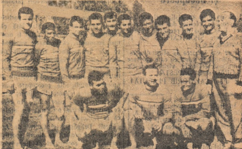
O amintire plăcută: antrenorul și jucătorii dinamoviști surzind în fața aparatului de fotografiat imediat după ce au îmbrăcat tricourile de campioni.