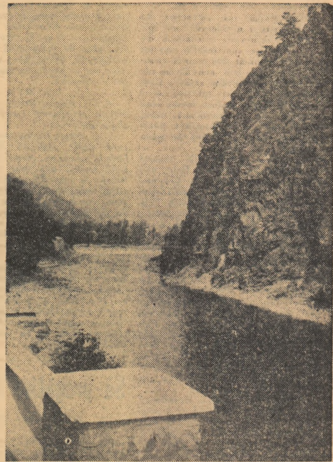
Toamnă pe Valea Oltului...