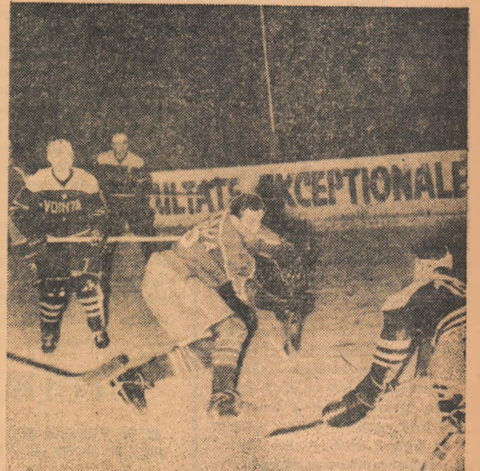
În aceste zile, echipele de hochei se pregătesc pentru primele jocuri ale campionatului republican. În clișeu, fază dintr-un meci Steaua—Voința, din sezonul trecut