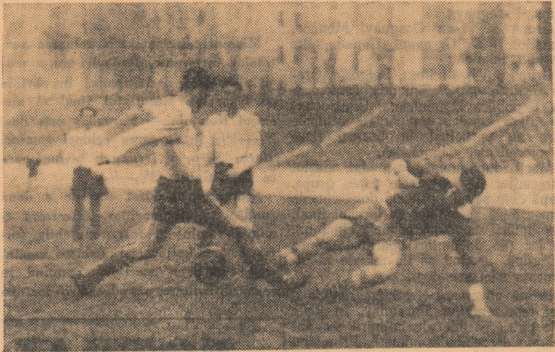
În careul de 16 m, al jucătorilor de la Electrica Fieni (tricouri albe). Fază din meciul Dinamo Victoria București—Electrica Fieni (2-1).

Dar echipele noastre de categoria C se mai „reîncarcă“ și printr-o serie de acte nesportive. Iată ce ne transmite corespondenții noștri din Călan și Salonta: „Arbitrul Gh. Lungan (Buc.) a trebuit să fluierie sfîrșitul partidei cu cîteva minute mai devreme, deoarece jucătorii echipei Metalul Tr. Severin au refuzat, timp de 3 minute, să repună mingea în joc la golul victorios înscris de gazde în min. 84“. (Victoria Călan — Metalul Tr. Severin),