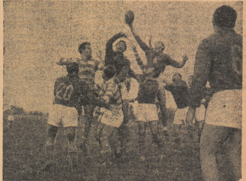
Fază din meciul Lotul R.P.R. — Constructorul: o frumoasă repunere din margine

Federația de specialitate organizează miercuri, ora 19,30, la sediul Consiliu- lui General UCFS, o consfățuire cu tema „Precizări pe marginea noilor modifi- cări ale regulamentului F.I.R.A.“. Prezintă prof. A. Barbu, antrenor fed- eral. Sînt invitați toți jucătorii, antre- norii și arbitrii din Capitală.