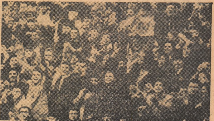
Deși timpul a fost rece, tribunele s-au... încălzit de seori, la jazele palpitante