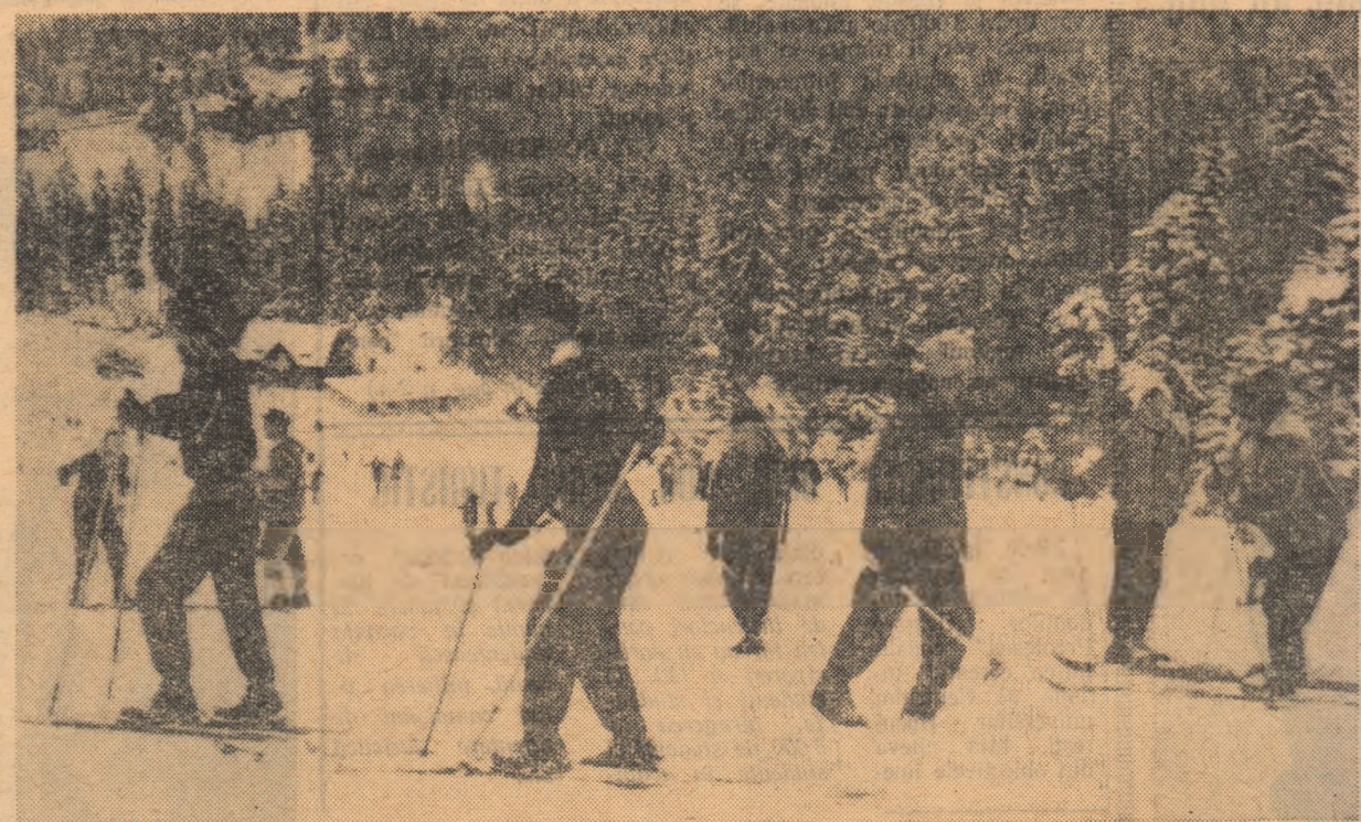
O frumoasă imagine a Clăbucelului într-o zi de sezon. Pe panta albă, tinerii și virșnicii schiază de zor, iar în clipele de răgaz admiră pitorescul peisaj al Predealului

— Ca activitate de performanță menționez „Cupa R.P.R.” pentru echipe de juniori, campionatele republicane pentru juniori și campionatele școlare, competiții la care sper că schiorii de la S.S.E. Predeal se vor prezenta la mîlțime. Un obiectiv la fel de important este centrul de inițiere care, ca și în anii trecuți, va funcționa în cadrul S.S.E. Pentru a-i asigura o activitate cît mai rodnică, am luat din vreme măsuri pentru procurarea echipamentului și materialului necesar. Vom depune toate eforturile ca acest centru de inițiere să funcționeze în