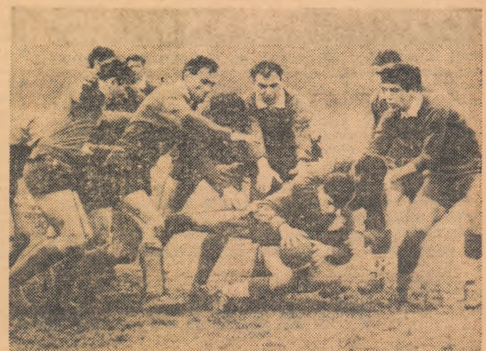
Luptă îndrîjită în meciul de rugbi Știința Timișoara — Constructorul T.R.C. Suceava, din cadrul campionatului de calificare. (Citiți amănunte în pag. a 6-a)