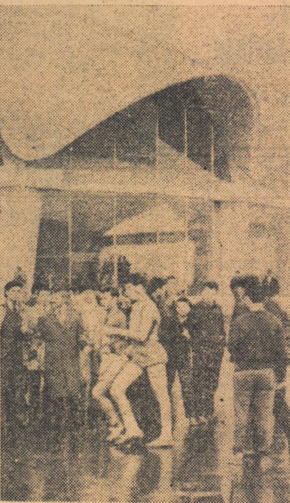
Cursa de marș „Cupa Gloria”. Alefii trec prin fața Circului de staț. (Citiți amănunte în pag. a 7-a)