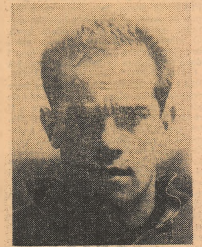
Unul dintre jucătorii de la „Inter” pe care-l vom vedea joia viitoare pe stadionul „23 August”, Luisito Suarez, jucător de bază nu numai la „Inter” ci și în reprezentativa Spaniei

a trecut acum Real cu 15 p, la egalitate cu Saragossa, urmate de Atletico Madrid cu 14 p. Iată rezultatele de duminică: Murchia — Sevilla 1—1, Betis — Elche 2—2, Levante — Atletico Bilbao 2—2, Barcelona — Cordoba 4—1, Saragossa — Oviedo 2—0, Palmas — Valencia 2—2. Echipa Espanol din Barcelona, în care joacă acum Di Stefano, a învins cu 4—1 pe Coruna.