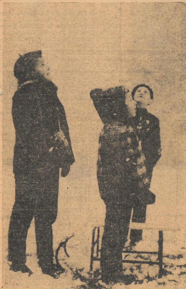
...apoi a stat, iar spre prînz a ieșit și soarele. Totuși cel dintîi mesaj al iernii nu l-a lăsat nepăsători pe copii.