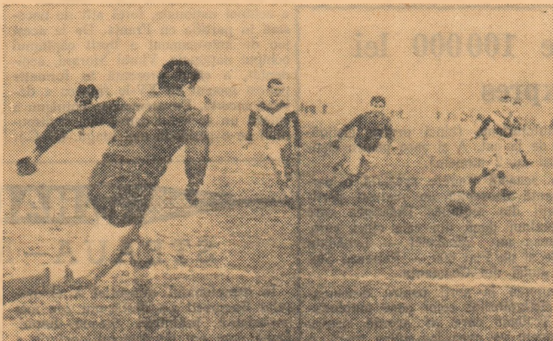
Fază din meciul Metalul București — Chimia Făgăraș

C.F.R. TIMIȘOARA — CLUJENA (0-4). Fotbaliștii celorștii și-au deziluzionat suporterii. Ei au practicat un joc sub orice critică. Clujenii au fost superiori de la început pînă la sfișșit. Realizatorii golurilor: Stanciu (min. 4, 26 și 89) și Lungu (min. 77). (St. Marton-coresp.).