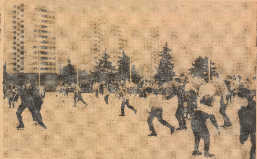
Instantaneu la noul patinoar artificial Floreasca. Duminică, zeci de copii bucureșteni au petrecut aici o autentică dimineață sportivă