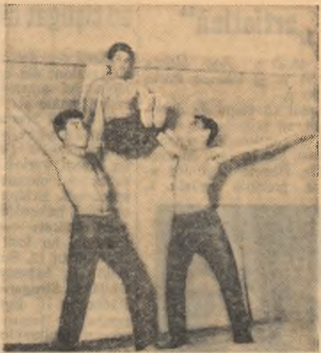
La asociația sportivă I.O.R. a avut loc, zilele trecute, deschiderea Spartachiadei de iarnă. În fotografie, aspect de la întrecerile de gimnastică

Aflăm că, în ultimul timp, un mare număr de tineri și-au exprimat dorința să participe la competițiile sportive organizate de consiliul asociației. Numeroși sportivi se întrec acum în prima etapă a Spartachiadei de iarnă. Colaborarea strînsă dintre consiliul asociației și comitetul U.T.M. a constituit un stimulent pentru tinerii care își dispută înțietatea „Sintem mulțumiți de cooperarea care a existat între orga-