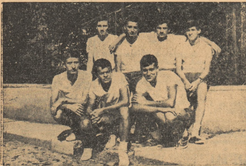
Echipa de juniori a Științei-Palatul Culturii care are o frumoasă comportare în competiția organizată în orașul Ploiești