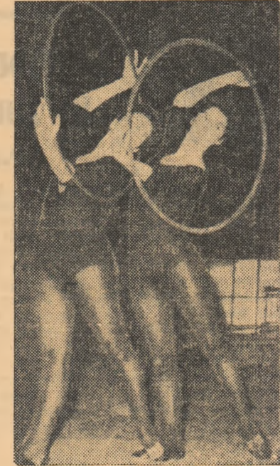
O frumoasă „secvență” din evoluția gimnastelor de la I.C.F. — exerciții cu cercuri — surprinsă de fotoreporterul nostru, T. Roibu...

De reținut faptul că etapa de duminică a constituit un criteriu de selecție pentru finala concursului republican care va avea loc la Iași, în ziua de 20 decembrie. Punctajul pentru această concurs se prezintă astfel: 1.