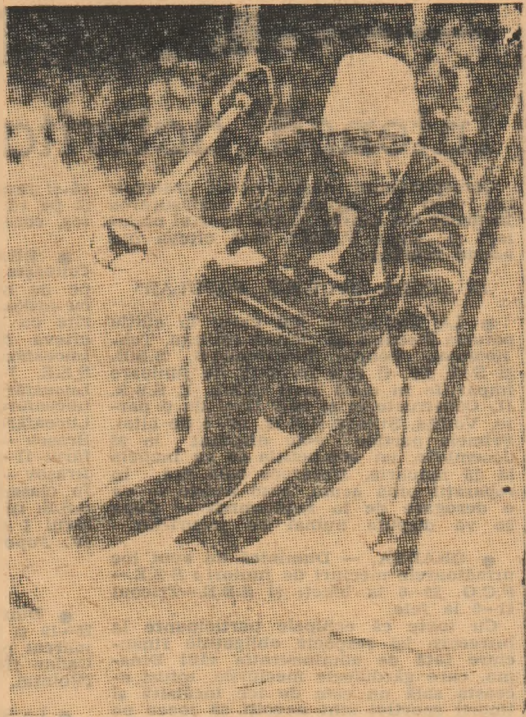
Campionul mondial și olimpic, Egon Zimmermann, și-a reluat recent antrenamentele după accidentul suferit în toamna acestui an