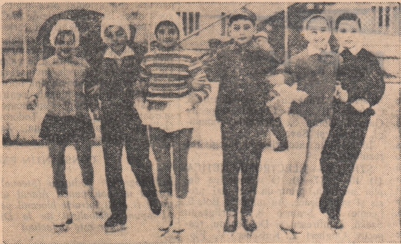
Un grup de concurenți la categoria 11-12 ani pozînd obiectivului fotografic