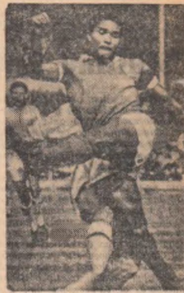
Eusebio (Portugalia) a marcat goluri în meciul de ieri cu echipa Tur-

Întîlnirea revanșă va avea loc la 18 aprilie, în Turcia.