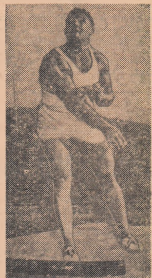
siv discului. Recent, la Los Angeles, el a obținut o performanță de 59,97 m.

PENTRU organizarea viitoarei Universiade și-au pus candidatura orașele Londra, Lyon și Tokio. Cele mai mari șanse le are orașul Tokio, care a câștigat o mare popularitate cu prilejul organizării J.O., însă Lyonul face altea promisiuni, încît s-ar putea ca, pînă la urmă, să obțină el organizarea.