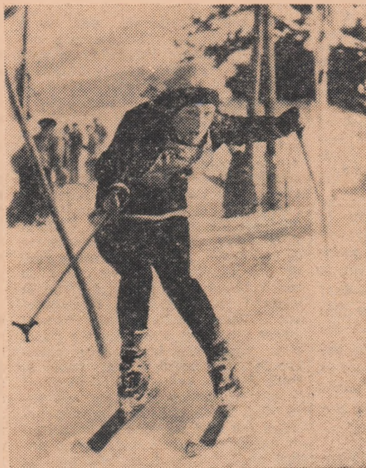
In foto: Heidi Biebl evoluind la concursul de la Grindelwald.

Pe pîrțile de la Wiesse (R.F.G.) s-a disputat, la lumina reflectoarelor, un concurs internațional de slalom special, care a reunit schiori și schioare din 7 țări. La feminin, pe primul loc s-a situat Heidi Biebl (R.F.G.), cronometrată în cele două manșe cu timpul de 1:46,12/100. Proba masculină a fost câștigată de Ludwig Leitner (R.F.G.) — 1:34,89/100, secundat de norvegianul Per Sunde — 1:35,41/100.