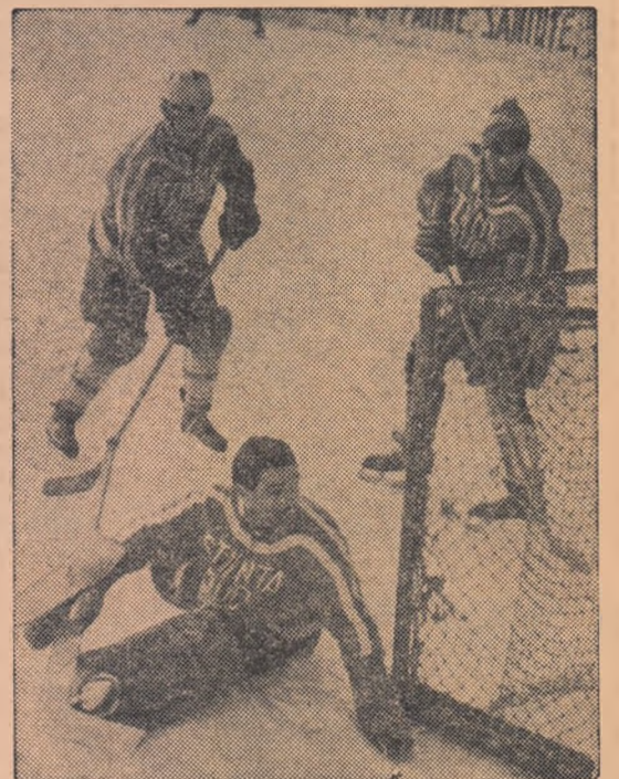
Un nou atac la poarta Științei. (Fază din meciul Voința-Știința București, 7—1).

Hotărîți să-și apere șansele cu multă dirzenie, studenții clujeni au