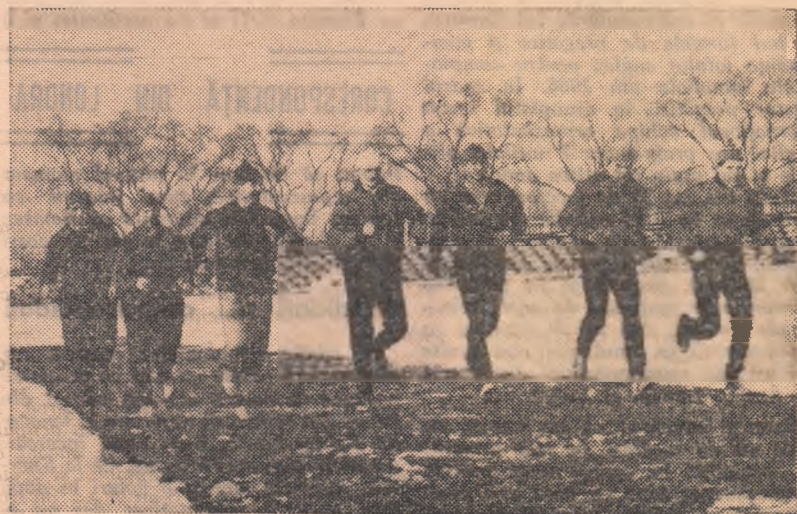
Leri după-amiază, pe pista stadionului Dinamo, seniorii și-au făcut obișnuitul antrenament.

— „Și cel care va fi hotărîtor în ceea ce privește selecția: campionatele republicane de cros care vor avea loc la 14 martie în București.