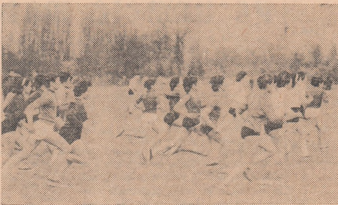
In imagine un aspect din intrecerea de cros rezervată juniorilor, desfășurată în primăvara anului trecut în Capitală.