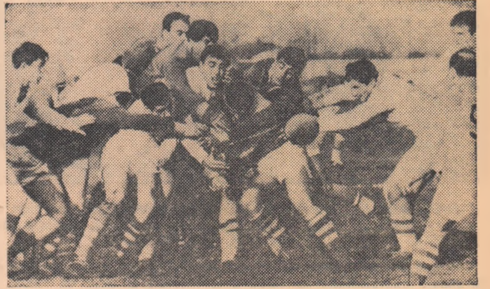
Unul din pasionantele dueli ale pachetelor de înaintași de la Grivița Roșie și Steaua (față din finala „Cupei 6 Martie” la rugbi)