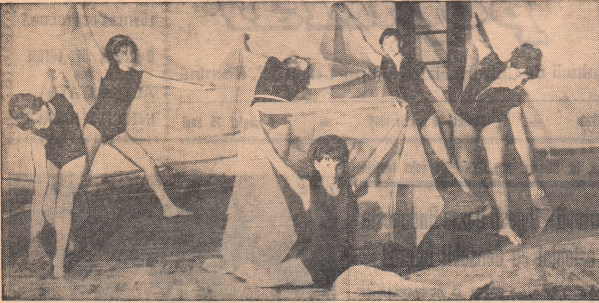
Ieri a avut loc în sala clubului Constructorul Jaza pe raion a Spartachiadei de iarnă la gimnastică. În fotografie, evoluția tinerelor de la A. S. Dimbovița

Întrecerile marii competiții sportive de mase, Spartachiada de iarnă a tineretului, se apropie de sfârșit. În unele localități au și început întrecerile pe plan raional. După cum ne transmitem corespondenții din Oradea, Iași, Sibiu, Galați, Tg. Mureș, Bacău, Brăila etc. în aceste zile campionii asociațiilor sportive la Spartachiada se pregătesc intens pentru a avea o comportare cât mai bună în finalele pe raion sau oraș.