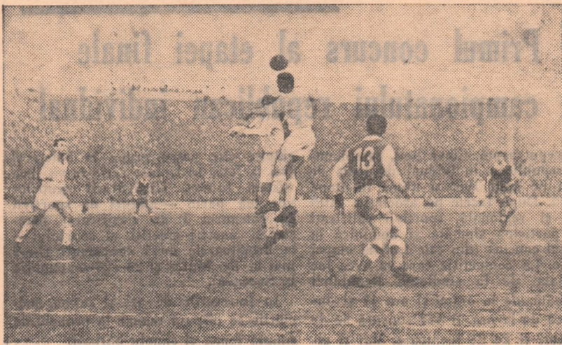
Iată spectaculozitatea fotbalului!

DINAMO PITEȘTI a făcut un him antrenament înaintea meciului cu Farul, întîlnind pe Metalul Tirgoviște în categoria B. Toți jucătorii piteșteni