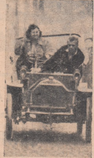
anul 1915. Vor participa 60 de automobile reprezentînd Franța, Italia, Elveția, Marea Britanie și alte țări.

INTRE 8 și 15 mai pe dealul Paris — Viena se va desfășura un raliu pentru automobile construite înainte de