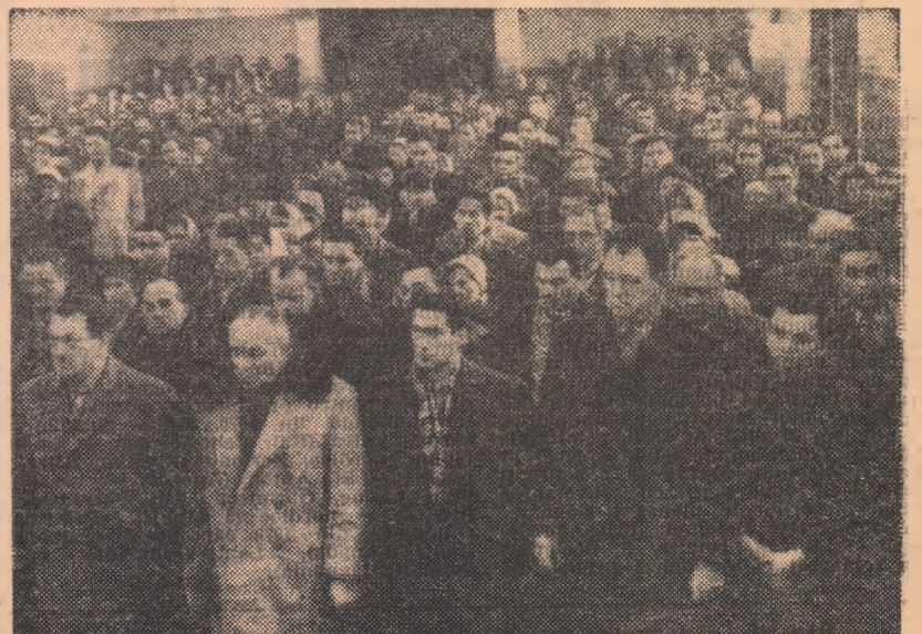
În timpul unei adunări de doliu din orașul Suceava.