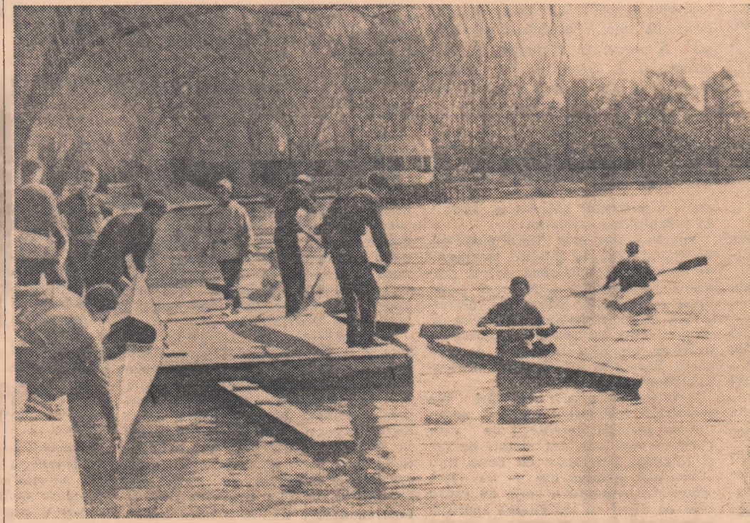
A venit primăvara pe Herăstrău și o dată cu ea, siluetele svelte ale ambarcațiunilor sportive strălucesc pe apele liniștite ale pitorescului lac bucureștean.