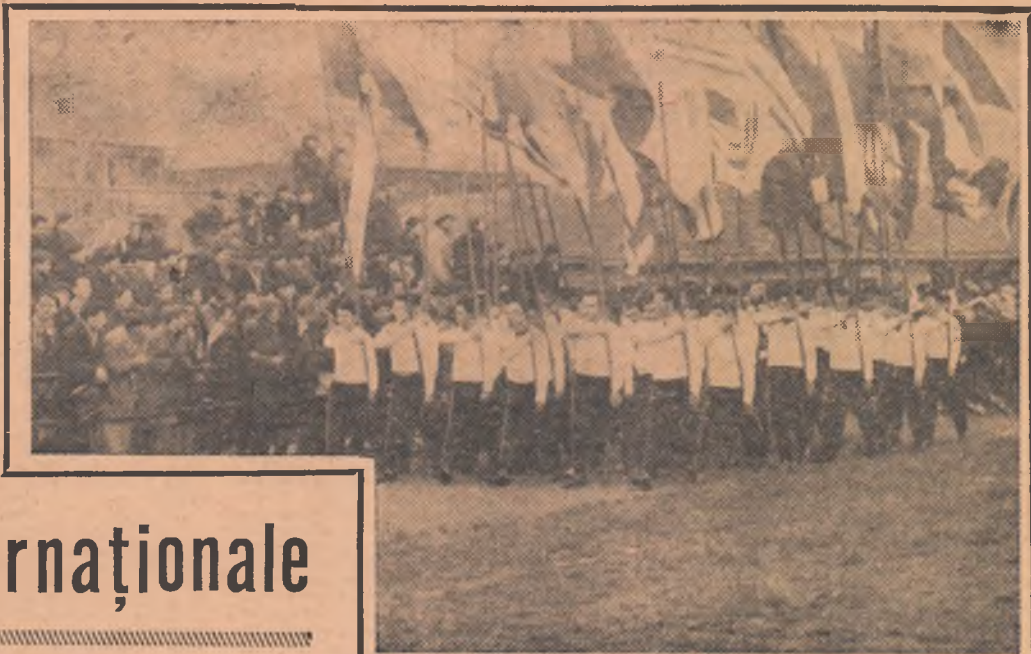
Apariția grupului de stegari pe pista stadionului din Parcul Copilului a marcat deschiderea Spartachiadei de vară a tineretului în raionul Grivița Roșie.