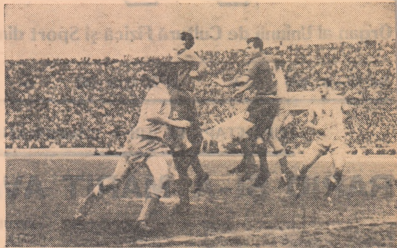
În fața porții, apărătorii dinamoviști resping un atac. Fază din meciul Progresul—Dinamo București.