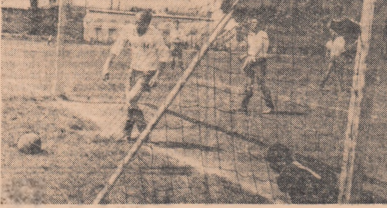
Minutul 44 și... 4-1 pentru Dinamo București. Fază din meciul Dinamo Victoria—Metrom Brașov

FORESTIERA SIGHETUL MARMĂȚIEI—TOPITORUL BAIA MARE (2-1). Joc viu disputat, cu multe faze spectaculoase, câștigat pe merit de Forestiera. Au înscris: Matiaș (min. 52 din 11 m), Dembrovșchi (min. 85) pentru Forestiera, Felman (min. 32) pentru Topitorul. (V. Godja).