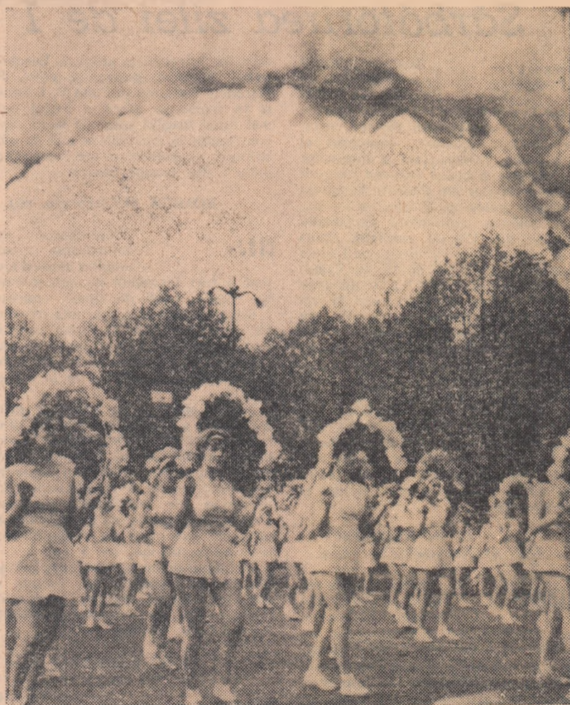
Fete și flori, în prima zi de primăvară...