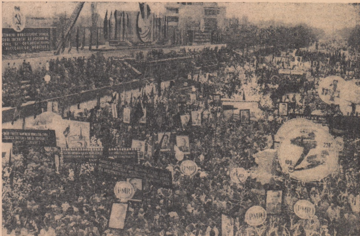
Trecînd prin fața tribunei principale, oamenii muncii din Capitală aclamă cu căldură și recunoștință pe conducătorii de partid și de stat

tonează Imnul de Stat al Republicii Populare Române.