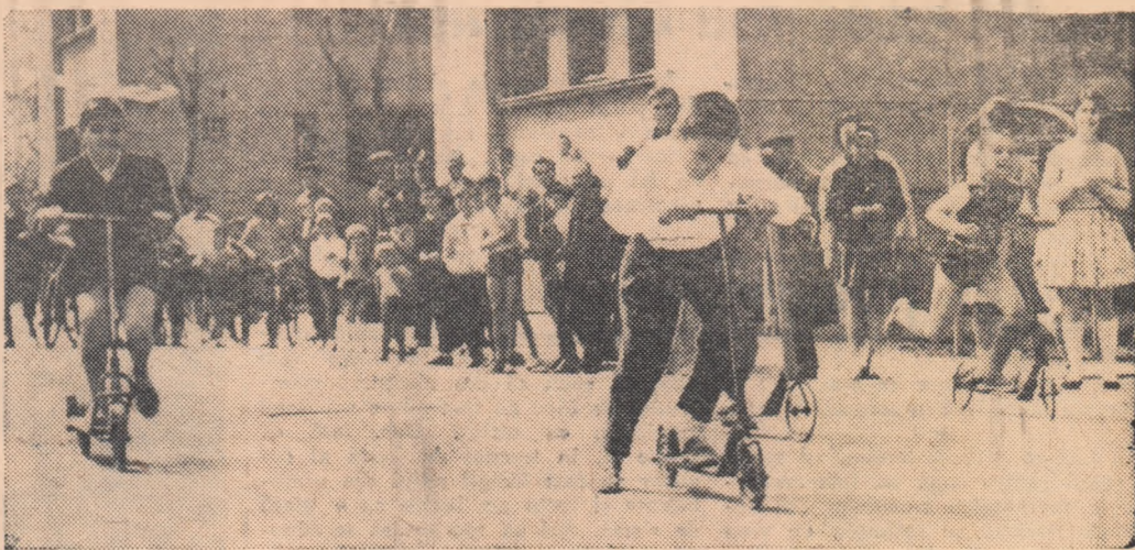
Un aspect dintr-o „serie” la trotinete, categoria 8—10 ani băieți

Duminică dimineața, pe terenurile de sport ale asociației sportive „Blocurile Ferentari” a fost zi de sărbătoare. Cîteva sute de elevi și pionieri și-au dat întâlnire la startul diferitelor probe de trotinete, biciclete, cros, fotbal, cîstind „ZIUA TINERETULUI” din țara noastră. Intrecerile au fost organizate de harnicul consiliu al aso-