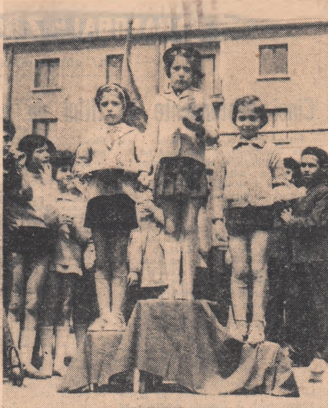
Festivitate de premiere. Pe micul podium improvizat au urcat primele trei clasate în proba de cros iețițe 10—12 ani

cros. Programul manifestațiilor sportive a fost încheiat cu un meci de fotbal între două selecționate, deosebite doar prin culoarea echipamentului: „albii” și „albaștrii”. Totuși, numai aici s-a produs o... contestație. La începutul acestui meci, cînd au apărut echipele pe teren, o mamă de pe marginea terenului,