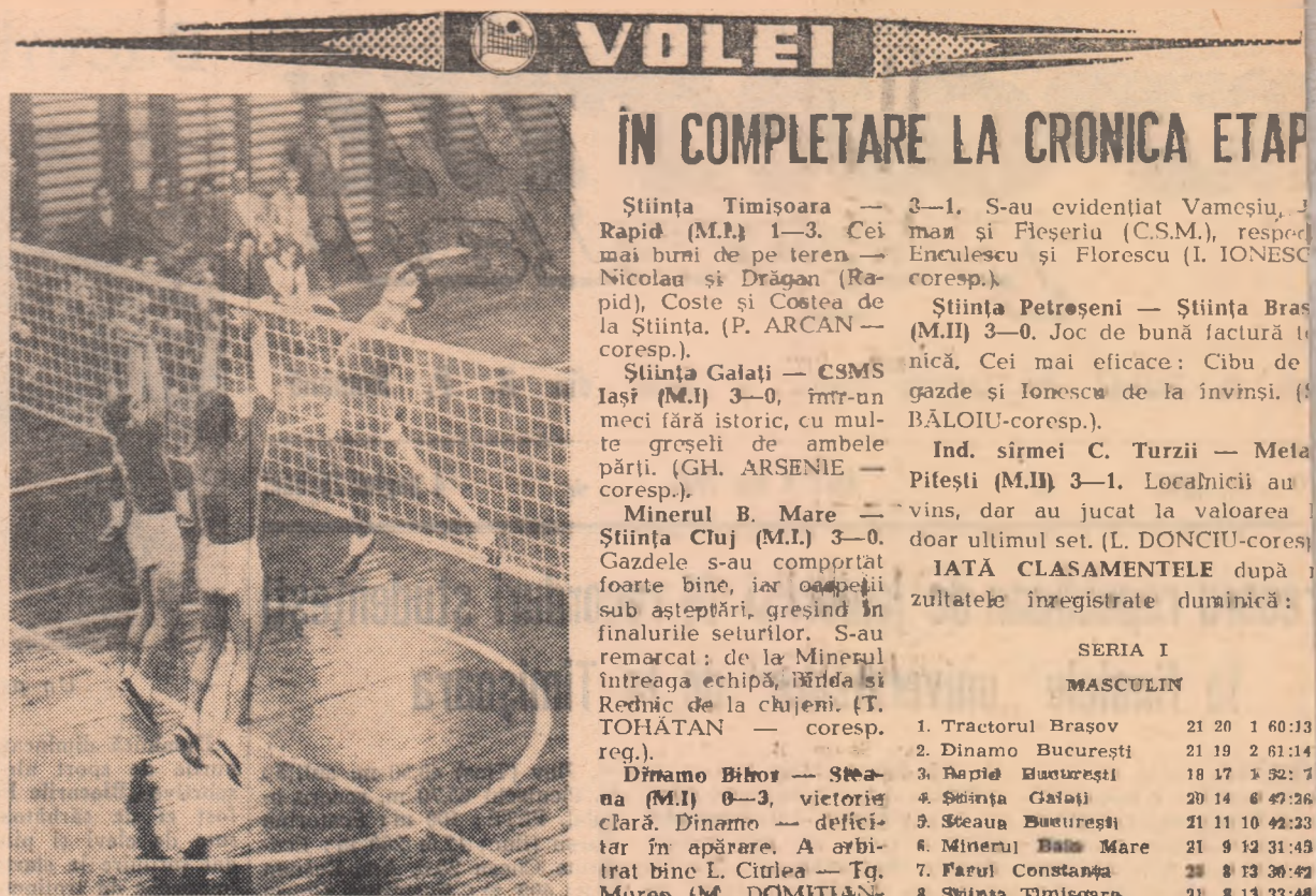
Un atac al echipei Electroputere Craiova în meciul de alaltăieri cu Semănătoarea, cîștigat cu 3-0 de bucureșteni