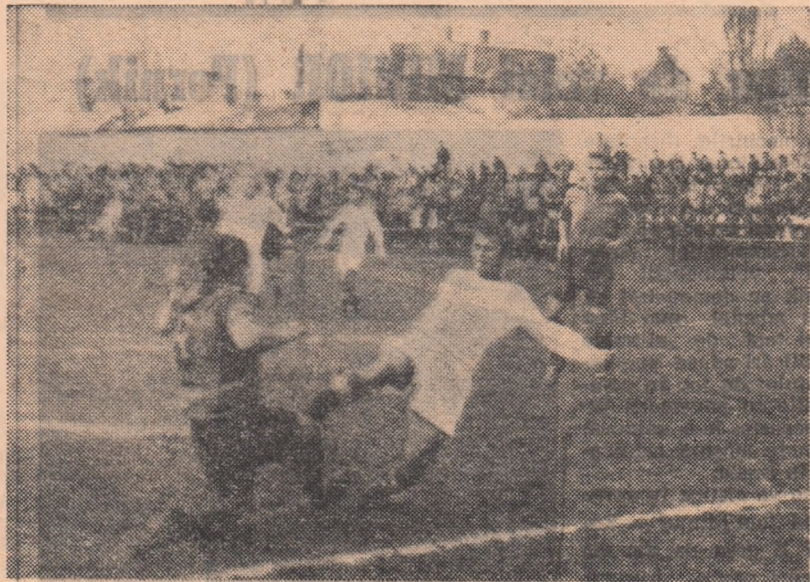
Pază din meciul Flacăra roșie București — Victoria Giurgiu (1—5)