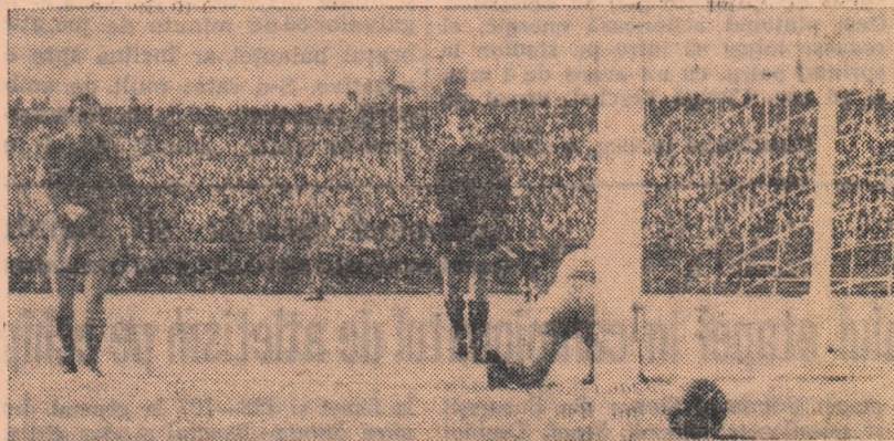
Consternare în tabăra bătărenilor. Ene II a scăpat singur, l-a driblat pe Bai și a marcat golul 4 al dinamoviștilor.