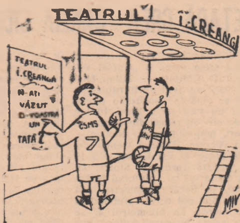
— Crezi că la noi face aluzie? —

C.S.M.S. joacă încă fără antrenor principal.