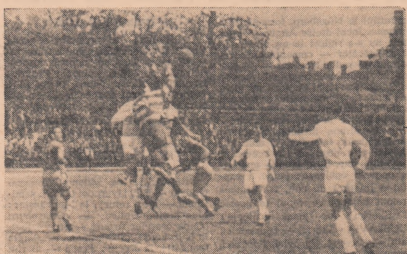
Unul din puținele atacuri ale gălățenilor este lămurit de Rămureanu, portarul studenților. (Fază din meciul Știința București—Siderurgistul 0—1).

DUMITRU ALEXANDRU tipograf la I. P. „Infomiatia”