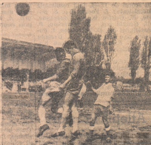
Fază din meciul Dinamo Victoria—Electrică Constanța încheiat cu rezultatul de 2—1 pentru gazda

Iată câteva rezultate pe care ni le-au comunicat corespondenții noștri prezenți la aceste jocuri: Metalul Tirgoviște — S.S.E. Ploiești 0—0, Electroputere Craiova — A. S. Cugir 3—0 (neprezentare !!), Știința Craiova — Jiul Petroșeni 2—0, Topitorul Baia Mare — Steaua roșie Salonta 1—1, Minerul Baia Sprie — Minerul Baia Mare 0—0, Dinamo București — Marina Mangalia 3—0 (neprezentare, echipa din Mangalia nu a prezentat buletinele de identitate ale jucătorilor), C.F.R. Pașcani — C.S.M.S. Iași 0—6, Unirea Tg. Mureș — A. S. Aiud 6—0, Rulmentul Birlad — Știința Galați 1—4, C.S.M. Sibiu — Gaz metan Mediaș 0—1, Dinamo Bacău — Metalosport Galați 2—0, Constructorul Brăila — Petrolul Moinești 4—1, Dinamo Victoria — Electrica Constanța 2—1, Chimia Oraș Gh. Gheorghiu-Dej — Crișul — Sătmăreana 6—0, Dinamo Flamura roșie Tecuci 6—1, A. S. Pitești — Metalul Pitești 6—1.